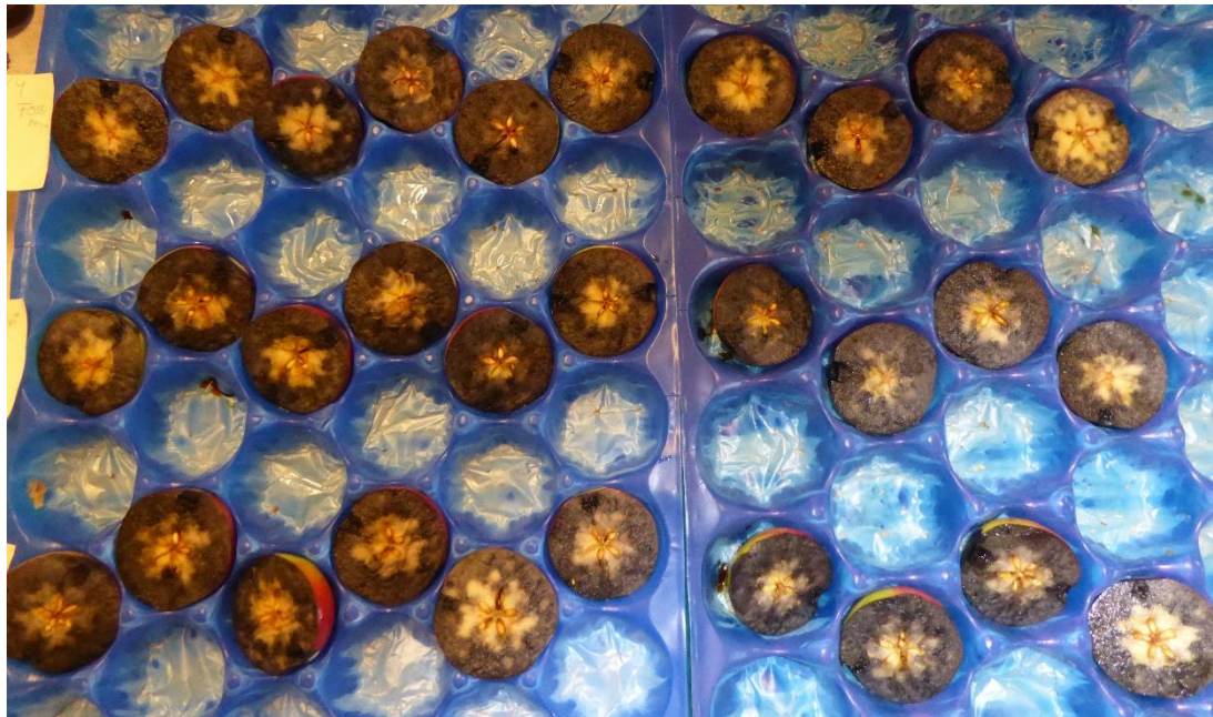
Øverst: Fosshagen, midten: Yttri, nederst: Aaberge

Glinsande raud, minimum C3 på fargeskalaen