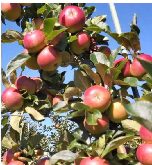
Discovery frå Hamre, Leikanger

Sjølvs om raudfargen på Discovery er i ferd med å kome, så er det enno for tidleg å hauste. Både grunnfarge og sukkerinnhald må bli betre. Stivenedbryting er berre så vidt kome i gong. OBS! Unge tre med få eple kan vere kome lenger i utvikling.