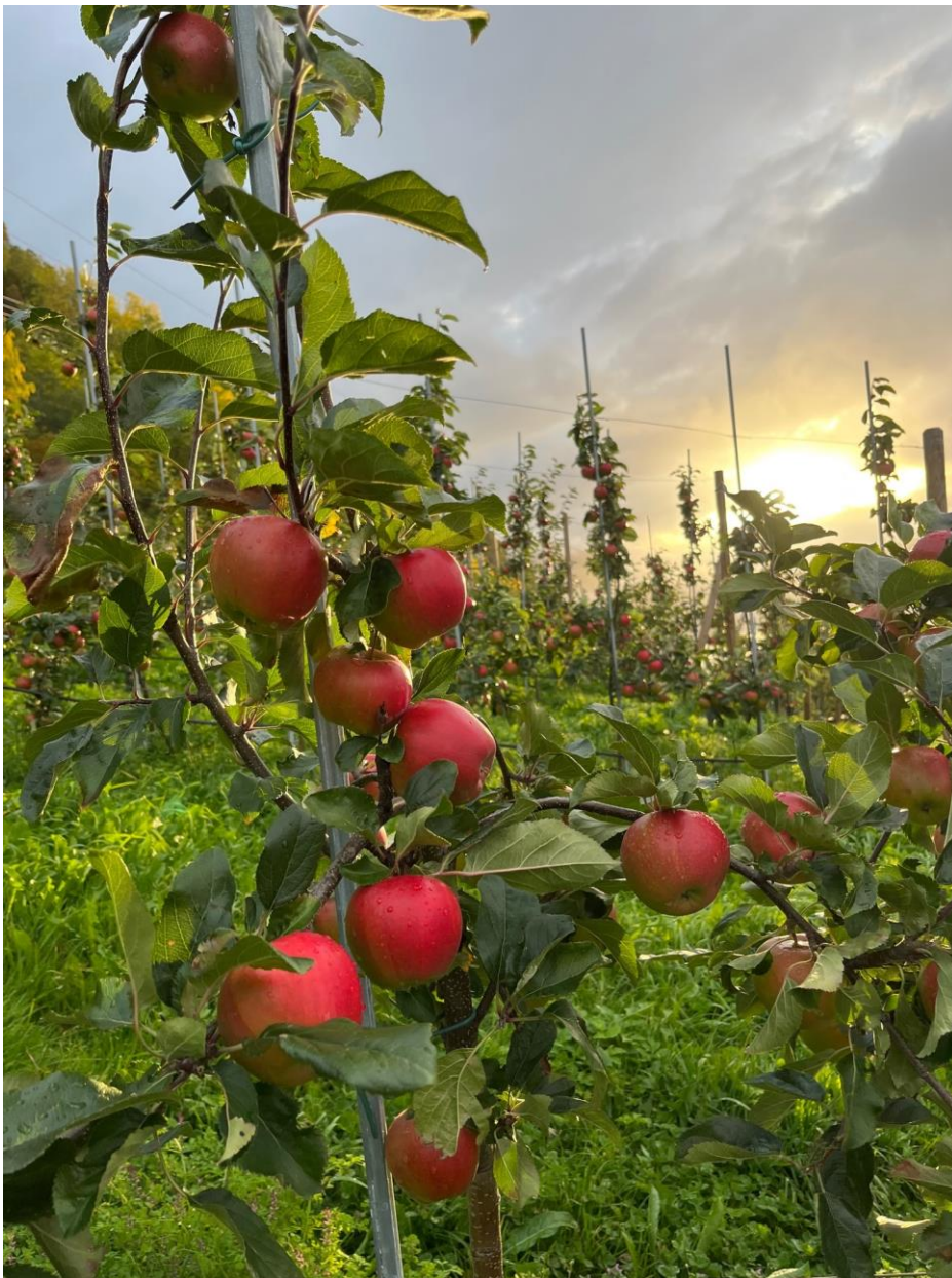
Fryd, Leikanger, 03.10.22

Rubinstep ser ut til å verte hausteklar til helga. Hausting av Fryd kan vente til neste veke. Neste måndag tar me årets siste haustetidsprøve, og då berre av Fryd.